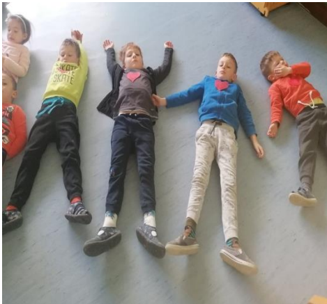
Vježba vizualizacije- mirišemo cvijet, pušemo svijeću